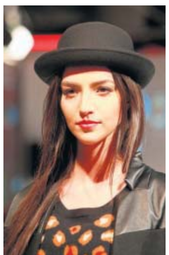
Elegant: Model im Jette-Outfit mit Hut.

Und wenn das Biker-Jäckchen zu Jeans-Mini- oder Bleistiftrock allein etwas bescheiden wirkt, sorgt ein Loop-Schal mit seinem Volumen für Ausgleich. Dazu eine Bommelmütze – der Winter kann kommen.