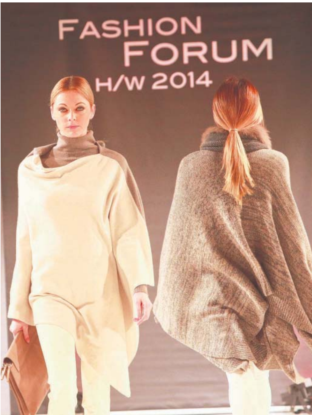
Oben schmal, unten weit: Die A-Form ist im kommenden Winter oft anzutreffen. Flauschige Wollcapas halten die Frau auch bei tiefen Temperaturen warm.

zieren und gleichzeitig das Geld der 50-Jährigen haben wollen, das geht nicht, wandte sich Elke Giese an die Zuhörer.