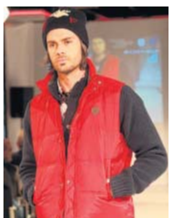
Sportlich: Daunenweste für kalte Tage (Basefield).