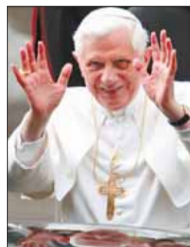
Papst Benedikt hat das Dokument gut geheißen.

Die Evangelische Kirche in Deutschland (EKD) hat das neue Vatikan-Dokument als Brückierung der Ökumene bezeichnet. Die vorgelegten »Antworten auf Fragen zu einigen Aspekten bezüglich der Lehre über die Kirche« der Glaubenskongregation seien eine »vertane Chance«, erklärte der EKD-Ratsvorsitzende Wolfgang Hu-