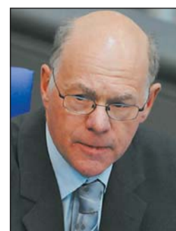
Norbert Lammert: »Entscheidung ist unverständlich.«

Berlin (ddp). Die Ablehnung der Berliner Behörden eines öffentlichen Gelöbnisses von Bundeswehrsoldaten vor dem Reichstagsgebäude stößt bei Bundestagspräsident Norbert Lammert (CDU) auf Kritik. Die Entscheidung sei »völlig unverständlich«, sagte Lammert gestern in Berlin. Es gebe »keinen geeigneteren Ort, das öffentliche Bekenntnis einer Armee zur parlamentarischen Demokratie zum Ausdruck zu bringen, als den Platz vor dem Reichstagsgebäude«. Das Berliner Bezirksamt Mitte hatte es abgelehnt, den Platz der Republik vor dem