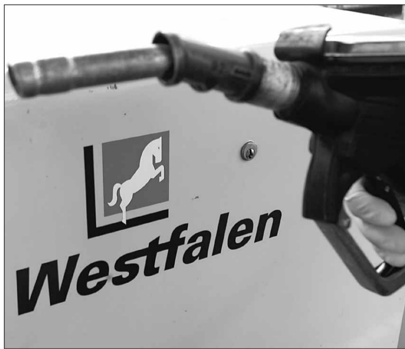
Gut verdient: Die Westfalen AG betreibt 250 Stationen der Marken Westfalen und Markant in Nordwestdeutschland.