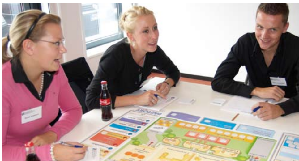
Die Studierenden beim Planspielunterricht